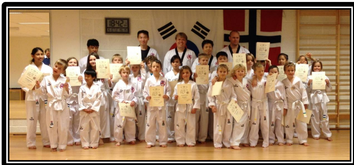
Barnegradering 16. oktober 2013

Klubben har avholdt en dan-gradering i perioden, og følgende personer har oppnådd nye dan-grader i klubben: