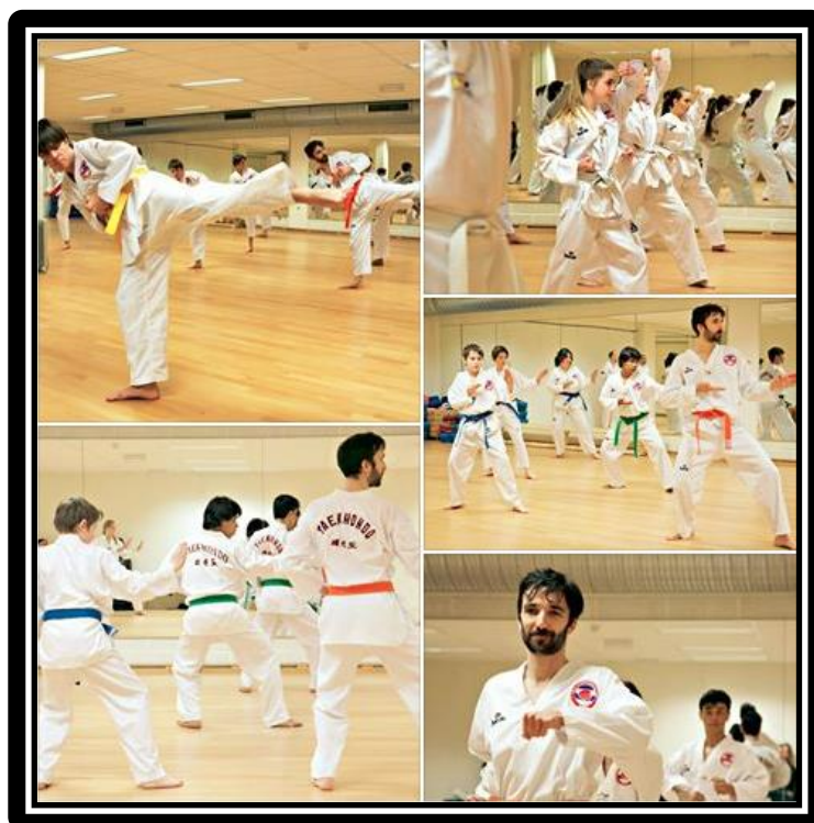
Bilde fra cup-graderingen 17. mars 2013