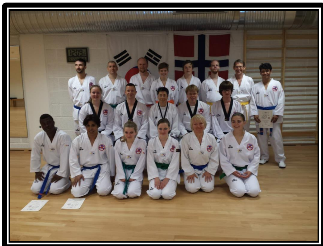
Bilde fra sommergraderingen 20. juni 2013